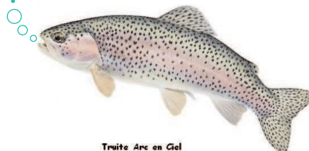
Truite Arc en Ciel

Trois dirigeants sur 10 ont suivi des études générales supérieures.