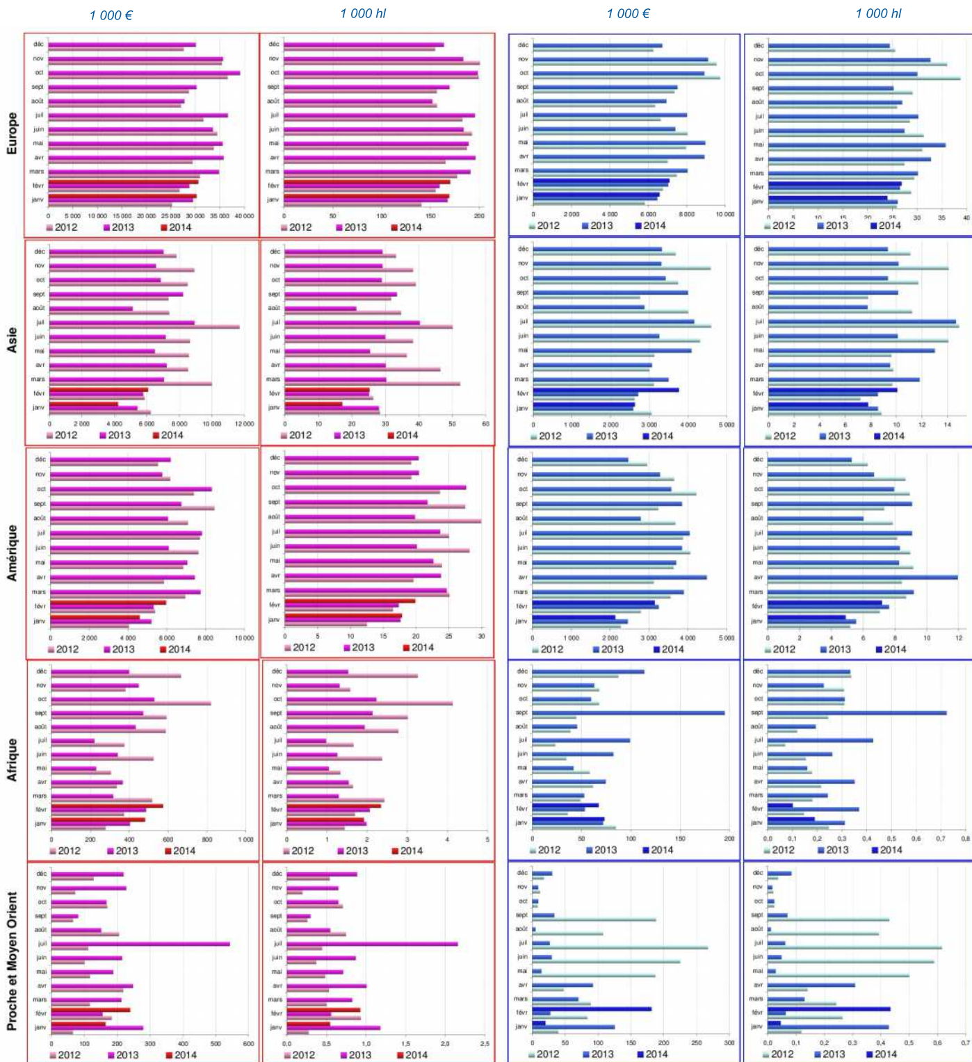
Source : Traitements Srise d'après Douane - publication du 8 avril 2014

Direction Régionale de l'Alimentation, de l'Agriculture et de la Forêt Service régional de l'information statistique et économique Place Antoine Chaptal - CS 70039 - 34060 Montpellier cedex 02 Téléphone : 04 67 10 18 50 Télécopie : 04 67 10 18 51 www.draaf.languedoc-roussillon.agriculture.gouv.fr